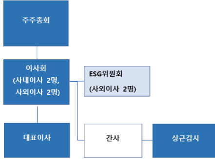
<표 4-1-1: 보고서 제출일 현재 이사회 및 이사회내 위원회 조직도>

당사의 지배구조는 주주총회를 최상위 의사결정기구로 하여 그 하위에 이사회를 중심으로 구성되어 있습니다. 이사회는 사내이사 2인과 사외이사 2인으로 구성되어 있으며, 회사의 주요 경영사항에 대한 의사결정과 경영진에 대한 감독 기능을 수행하고 있습니다. 또한 이사회 내에는 ESG위원회를 설치·운영하고 있으며, 해당 위원회는 사외이사 중심으로 구성되어 지속가능경영 및 주요 ESG 관련 사항을 심의하고 그 결과를 이사회에 보고하고 있습니다. 한편 이사회 운영을 지원하기 위하여 사안별로 관련 부서 팀장이 간사 역할을 수행하고 있으며, 대표이사는 이사회의 의사결정에 따라 회사 경영을 집행합니다. 또한 상근감사는 독립적인 감사기구로서 이사회 및 경영진의 업무 수행에 대해 감사 기능을 수행하고 있습니다. 이와 같은 구조를 통해 당사는 이사회 중심의 의사결정 체계와 함께 위원회 및 감사기구 간 상호 견제와 균형이 이루어질 수 있도록 운영하고 있습니다.